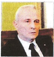
Angelo Piazzoli Fondazione Credito Bergamasco