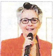
Loredana Poli assessore Comune di Bergamo