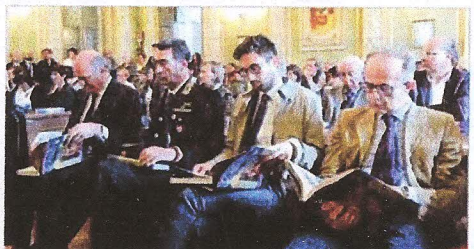
L'affollata sala del Consiglio della Provincia dove venerdì 13 maggio è avvenuta la presentazione del torneo di tennis 2016