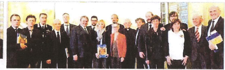
Il gruppo delle autorità e dei rappresentanti delle istituzioni cui è destinata la solidarietà 2016