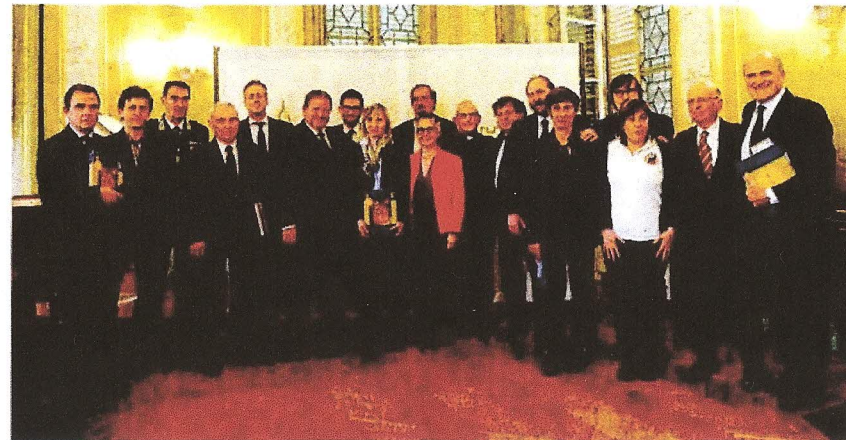
Venerdì scorso la presentazione in Provincia